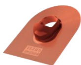
Красный ~RAL 3009