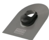
Серый ~RAL 7015