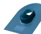
Синий ~RAL 5005