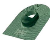
Зеленый ~RAL 6020