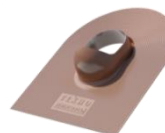
Коричневый ~RAL 8017